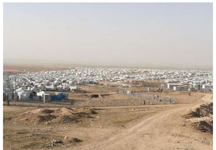
Foto: kamp Khanki Koerdistan

Ook internationale organisaties, zoals UNHCR en Amnesty International, bevestigen dat de huidige omstandigheden een veilige en duurzame terugkeer niet toelaten.