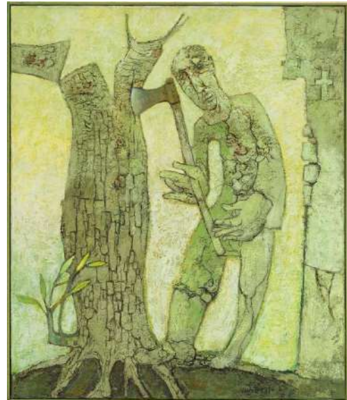
Sjef Hutschemakers, De dood van de houthakker , 1990, olieverf op doek, 101,7 x 86,8 cm, Collectie SCHUNCK, gemeente Heerlen. Schenking dsm-firmenich, 2024.

Na weken van kijken, kiezen, discussiëren, schrijven en zelfs componeren, presenteert zij nu haar favoriete werken tijdens de tentoonstelling De dood van de houthakker , genoemd naar één van de geselecteerde werken.