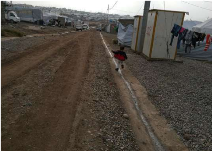
Foto: kamp Khanki Koerdistan