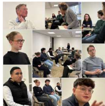
De jongeren ambassadeurs in gesprek met DGIS

Een diverse tafel met bewoners die hier al hun hele leven wonen tot een vrouw uit Afghanistan die met haar gezin een nieuw bestaan opbouwt in Heerlen, en een jonge vrouw met Chinese roots, opgegroeid in de wijk, inmiddels afgestudeerd in Delft en woonachtig in Utrecht, maar nog altijd verbonden met haar thuisbasis. Samen brachten zij een eerlijk beeld van wat er speelt en wat nodig is.